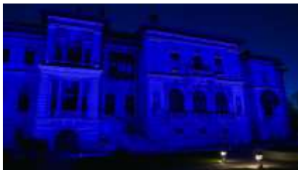
Pentru mai multe imagini, click pe poză

https://www.presidency.ro/ro/media/comunicate-de-presa/administratia-prezidentiala-marcheaza-ziua-internationala-de-constientizare-a-autismului1648883263