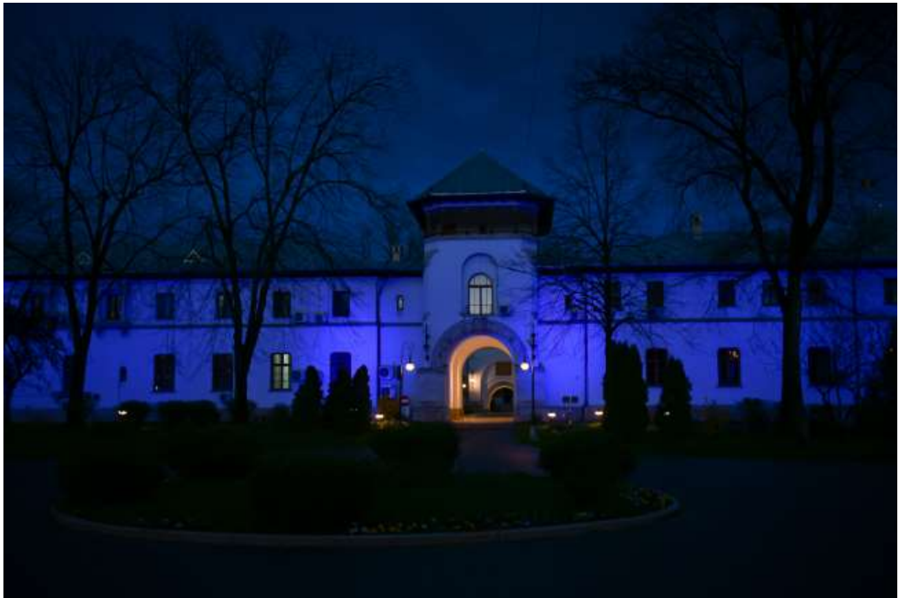
Iluminarea Palatului Cotroceni - Ziua Internațională de Conștientizare a Autismului Pentru mai multe imagini, click pe poză sau aici