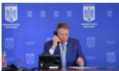
Pentru mai multe imagini, click pe poză

La discuții au mai participat Președintele Franței, Emmanuel Macron, Președintele Poloniei, Andrzej Duda, Prim-Ministrul Marii Britanii, Boris Johnson, Prim-Ministrul Canadei, Justin Trudeau, Cancelarul Germaniei, Olaf Scholz, Prim-Ministrul Italiei, Mario Draghi, Prim-Ministrul Japoniei, Fumio Kishida, Secretarul General al NATO, Jens Stoltenberg, Președintele Comisiei Europene, Ursula von der Leyen, și Președintele Consiliului European, Charles Michel.