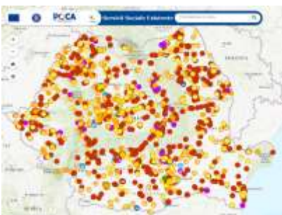
Pentru a accesa harta, click pe poză

După categoriile de beneficiari, serviciile sociale pot fi clasificate în: