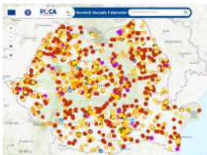
Pentru a accesa harta, click pe poză

Harta interactivă a serviciilor sociale existente în România poate fi accesată aici: https://portalgis.servicii-sociale.gov.ro/webapps/servicii_sociale/