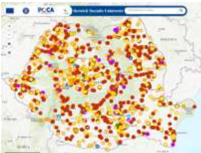
Pentru a accesa harta, click pe poză

Harta interactivă a serviciilor sociale existente în România poate fi accesată aici: https://portalgis.servicii-sociale.gov.ro/webapps/servicii_sociale/