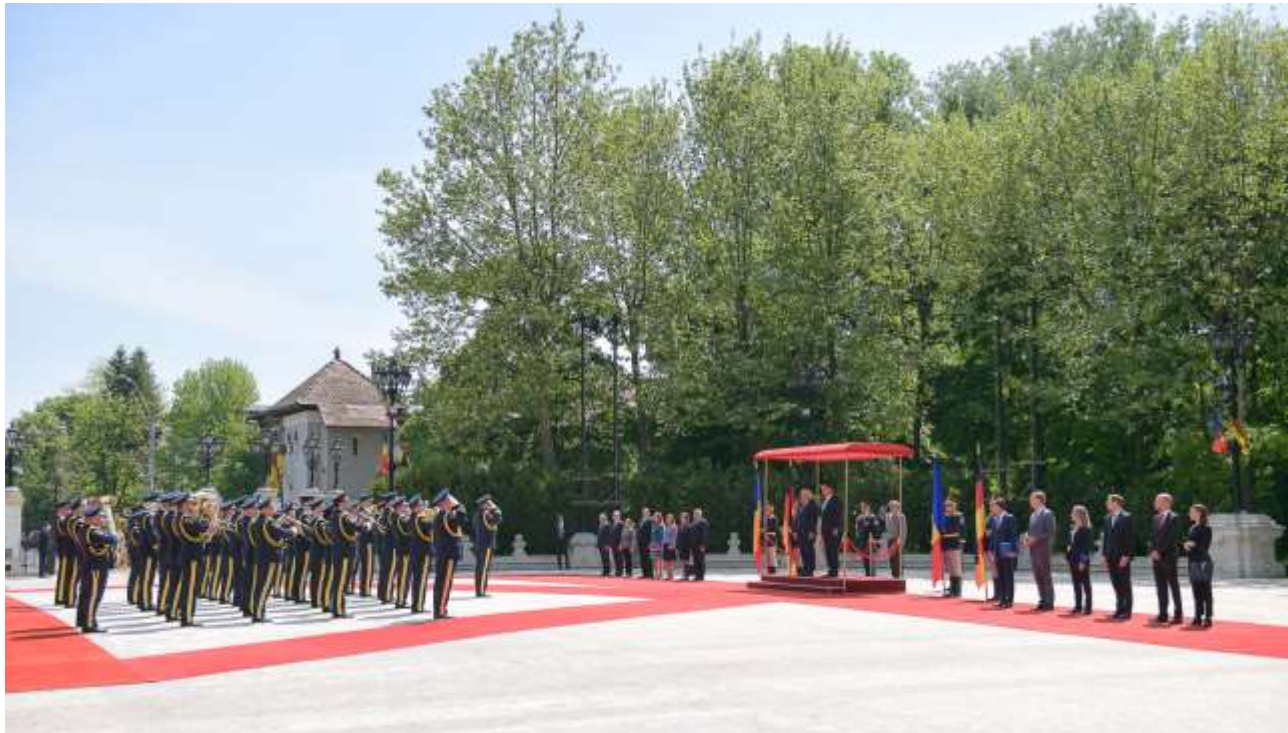
Primirea Președintelui Republicii Federale Germania, Frank-Walter Steinmeier, la Palatul Cotroceni Pentru mai multe imagini click aici sau pe poză