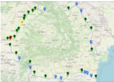
Pentru condițiile de trafic de la frontierele României, click pe poză

Aplicația este disponibilă aici: https://www.politiadefrontiera.ro/ro/traficonline/?vw=1 și pe site-ul Poliției de Frontieră Română: https://www.politiadefrontiera.ro/ .