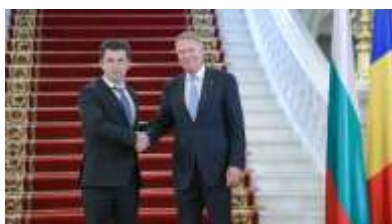
Pentru mai multe imagini, click pe poză

Vineri, 29 aprilie 2022, Președintele României, Klaus Iohannis, l-a primit la Palatul Cotroceni, pe Prim-ministrul Republicii Bulgaria, Kiril Petkov, aflat în vizită oficială în România.