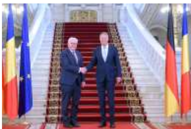
Pentru mai multe imagini, click pe poză

Astfel, am reconfirmat sprijinul deplin pe care România îl acordă tuturor refugiaților din Ucraina care vin în țara noastră, prin măsuri concrete, inclusiv prin operaționalizarea centrului logistic umanitar de la Suceava. Este crucial ca sprijinul Uniunii Europene și al statelor membre să continue, atât pentru Ucraina, cât și pentru refugiații ucraineni.