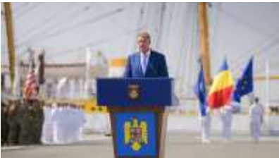
Pentru mai multe imagini, click pe poză

În ultimii ani, am acționat constant și decisiv pentru ca regiunea Mării Negre să fie recunoscută drept una de interes major pentru comunitatea euroatlantică, pe măsura importanței sale geostrategice de hotar al Alianței Nord Atlantice și al Uniunii Europene.