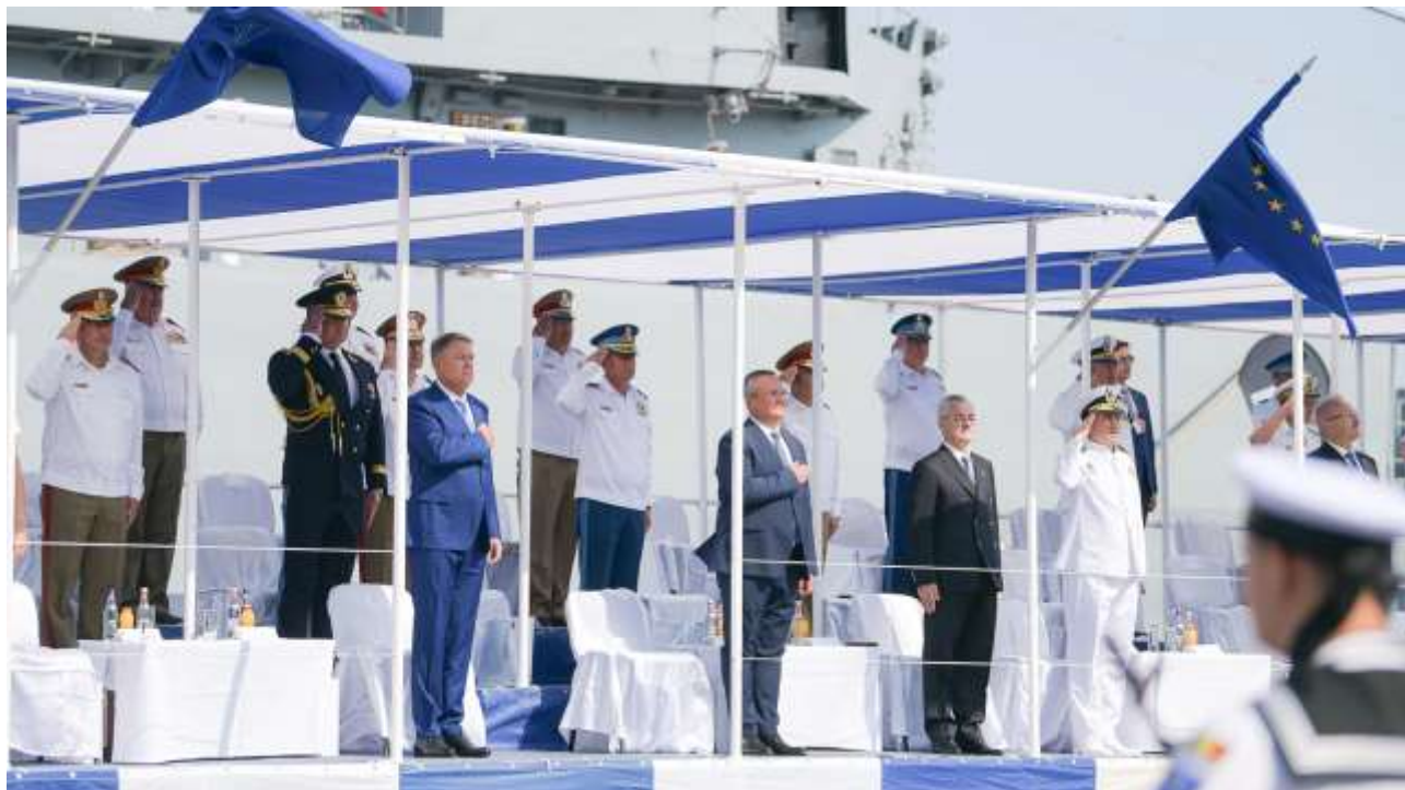
Participarea Președintelui României la festivitățile prilejuite de Ziua Marinei Române (15 august) (click aici sau pe poză pentru mai multe imagini)

NEWSLETTER nr. 330 din 1 septembrie 2022