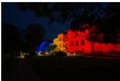
Pentru mai multe imagini, click pe poză

”LIMBA ROMÂNĂ ESTE TEMELIA IDENTITĂȚII NOASTRE. O PREȚUIM FOLOSIND-O CORECT, CULTIVÂND-O ȘI AJUTÂNDU-I PE ALȚII SĂ PRIMEASCĂ DARUL DE A O ÎNVĂȚA ȘI DE A SE BUCURA DE BOGĂȚIA EI”